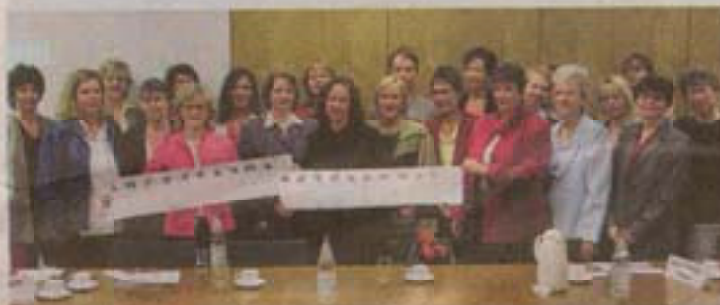
In der knapp einen Meter breiten Broschüre stellen zwanzig Unternehmerinnen ihre Firmen kurz vor.